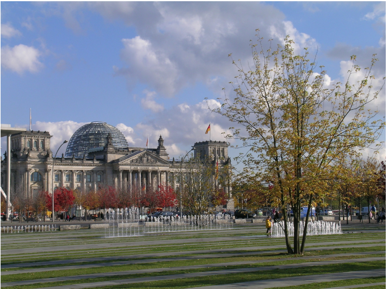
Berliner Reichstag, Sitz unseres Bundestags, aufgenommen von Herrn Nowotzin

Wir wünschen der ganzen Schulgemeinschaft erholsame Ferien. Wir freuen uns auf ein gesundes und munteres Wiedersehen im Schuljahr 2017/2018